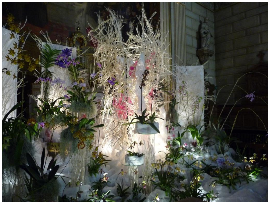
Orchidées exposées par les Serres du Sénat. Exposition de Paris 2012

C'est une partie de ces collections qui sera exposée à l'occasion de la Biennale d'Orchidées de Pringy.