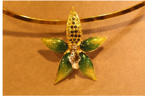
De véritables fleurs d'orchidées sont transformées en bijoux par Valérie Lavault