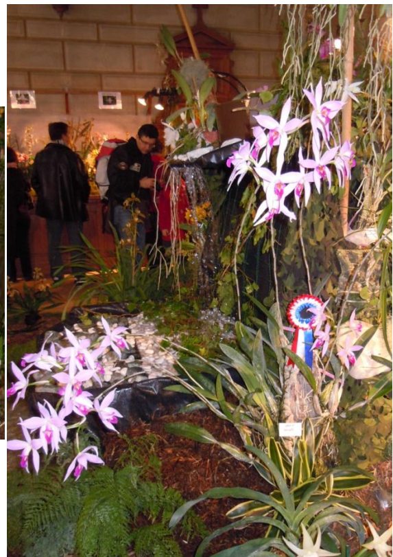
Laelia anceps , présenté par AM Orchidées, Champion de l'exposition, Paris 2012