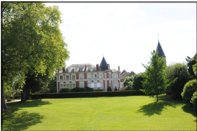
La mairie et son parc

Toute la richesse d'une histoire qui fait partager l'ambiance éternelle d'une ville de province où l'on prend le temps de vivre.