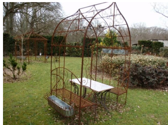
Ferronnerie d'art proposée par les Pépinière du Bois Joli