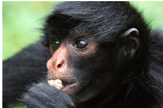
Singe araignée (portrait)