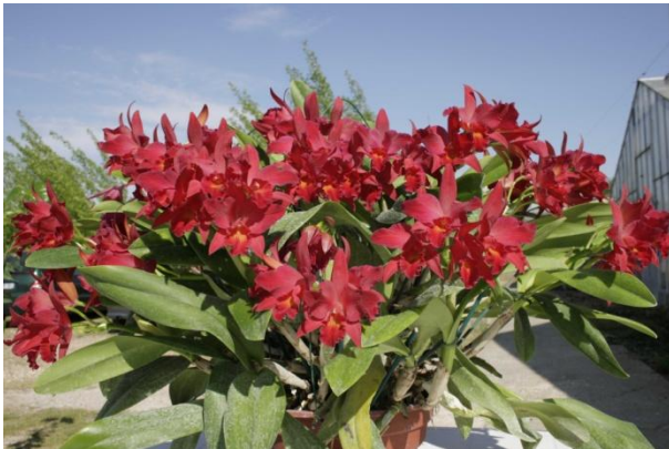
Sophrolaeliocattleya Jewel Box 'Sheherazade'