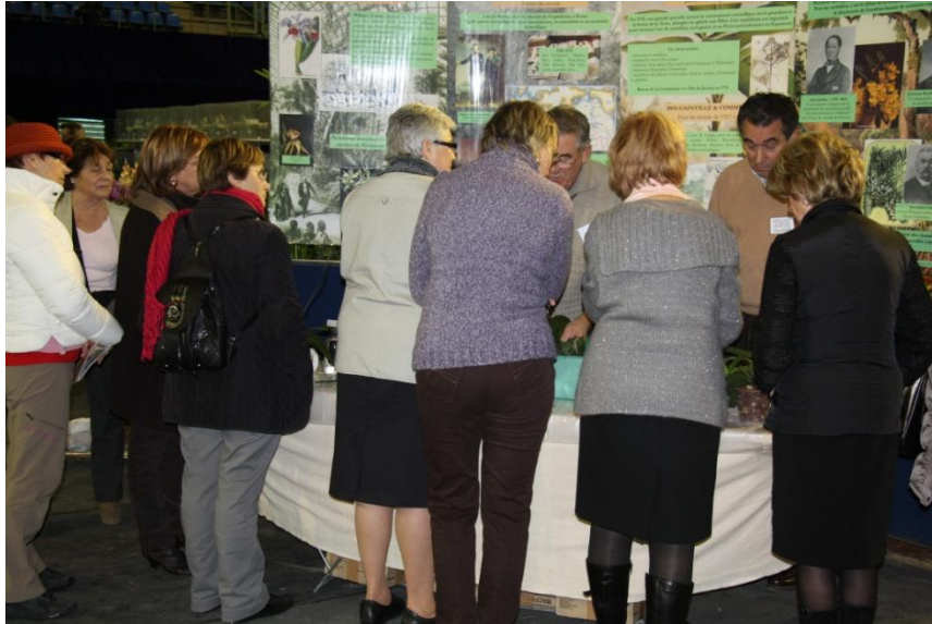
Les démonstrations de rempotage sont toujours suivies attentivement par les visiteurs

Les experts d'Orchidée 77, présents pendant l'exposition, se tiendront à la disposition des visiteurs pour répondre aux questions sur la culture des orchidées. Les visiteurs pourront apporter leurs plantes. Un diagnostic sur l'état de la plante sera effectué, des conseils seront prodigués et la plante sera rempotée si cela s'avère nécessaire.