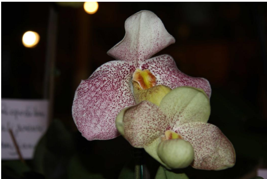
Paphiopedilum emersonianum x P. hangianum . 1er prix Exposition de Pringy 2011