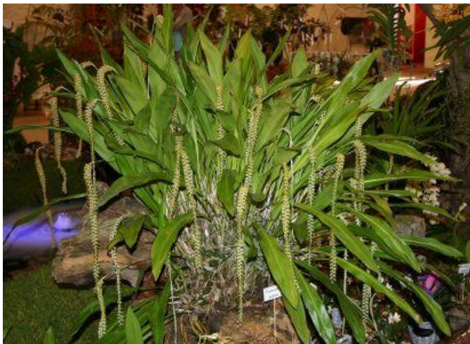
Dendrochilum filiformis , présenté par Reinhart Orchideeën, Champion de l'exposition, Gretz-Armainvilliers 2012

L'exposition de Pringy ne dérogera pas à cette tradition. Un jugement sera réalisé par l'Ecole des Juges d'Orchidées (EJO) de la Société Nationale d'Horticulture de France (SNHF). Deux prix seront attribués aux professionnels, l'un pour la plus belle espèce botanique, l'autre pour le plus bel hybride. Dans les mêmes conditions, deux autres prix seront attribués aux amateurs. Enfin la plante ayant obtenu la note la plus élevée recevra la distinction de Championne de l'exposition. De plus des médailles d'or, d'argent et de bronze récompenseront les plantes ayant obtenu les plus hautes notes.